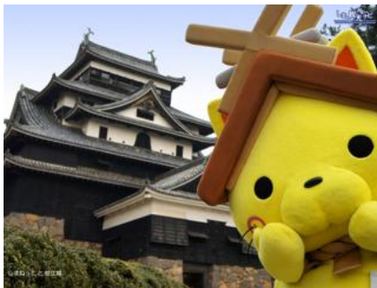
(島根県観光キャラクターしまねっこ公式ホームページより)